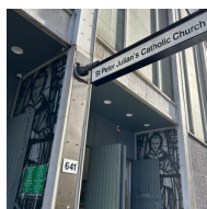
St Peter Julian's Catholic Church (聖伯多祿朱利安堂) 641 George St, Haymarket NSW 2000