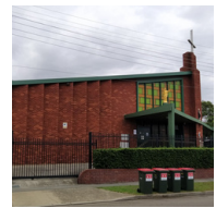
St Dominic's Church (聖道明教堂) The Crescent & Hornsey Rd, Homebush West, NSW 2140