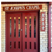
Asiana Centre (亞洲中心) 38 Chandos Street, Ashfield NSW 2131