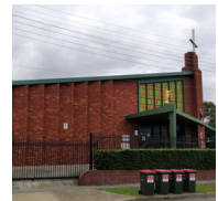
St Dominic's Church (聖道明教堂) The Crescent & Hornsey Rd, Homebush West, NSW 2140