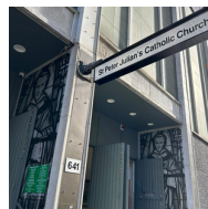
St Peter Julian's Catholic Church (聖伯多祿朱廉堂) 641 George St, Haymarket NSW 2000