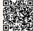
「希望的朝聖者」 歌曲