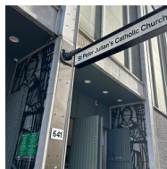
St Peter Julian's Catholic Church (聖伯多祿朱廉堂) 641 George St, Haymarket NSW 2000