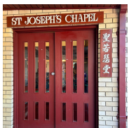
Asiana Centre (亞洲中心) 38 Chandos Street, Ashfield NSW 2131