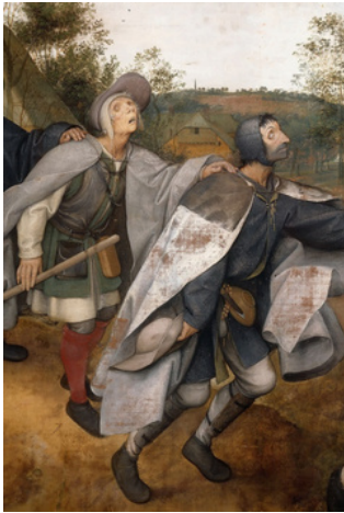
Pieter Bruegel the Elder Parable of the Blind, detail, 1568

Can a blind person guide a blind person? Will not both fall into a pit?